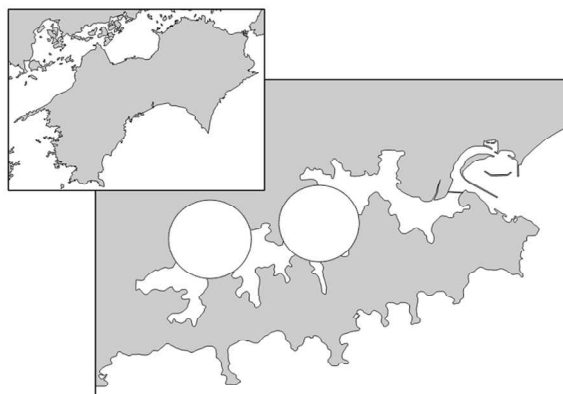
珪藻 最大細胞密度