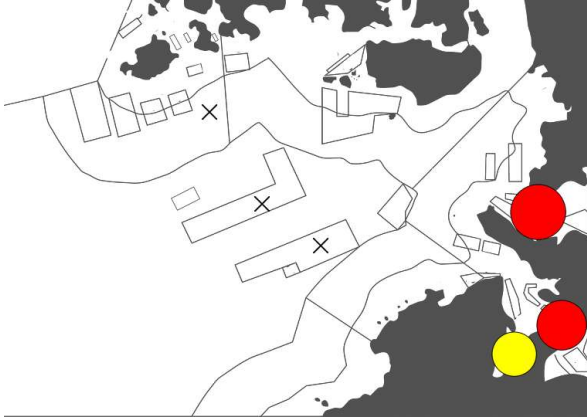
コクロディニウム・ポリクリコイデス 最大細胞密度