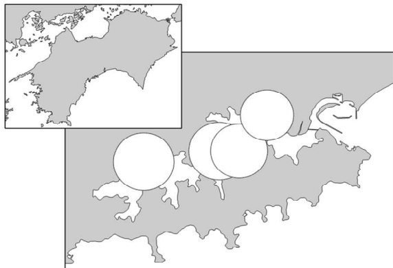
珪藻 最大細胞密度