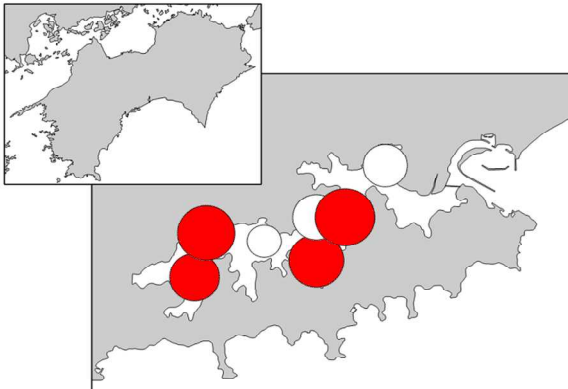
ケラチウム属 最大細胞密度