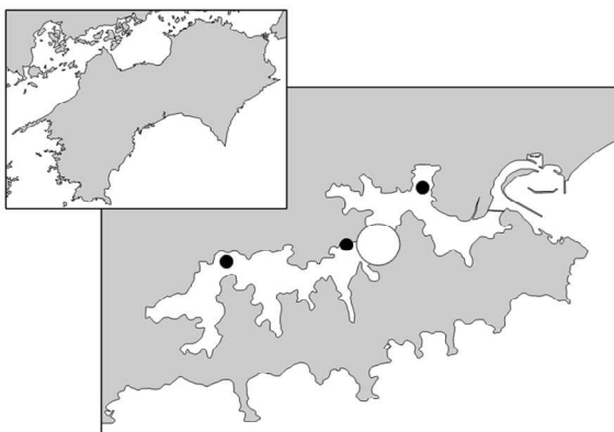
オクタクティス属 最大細胞密度