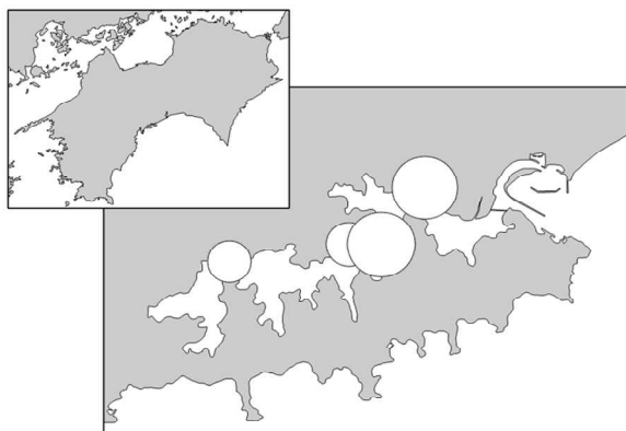
ヘテロシグマ・アカシオ 最大細胞密度